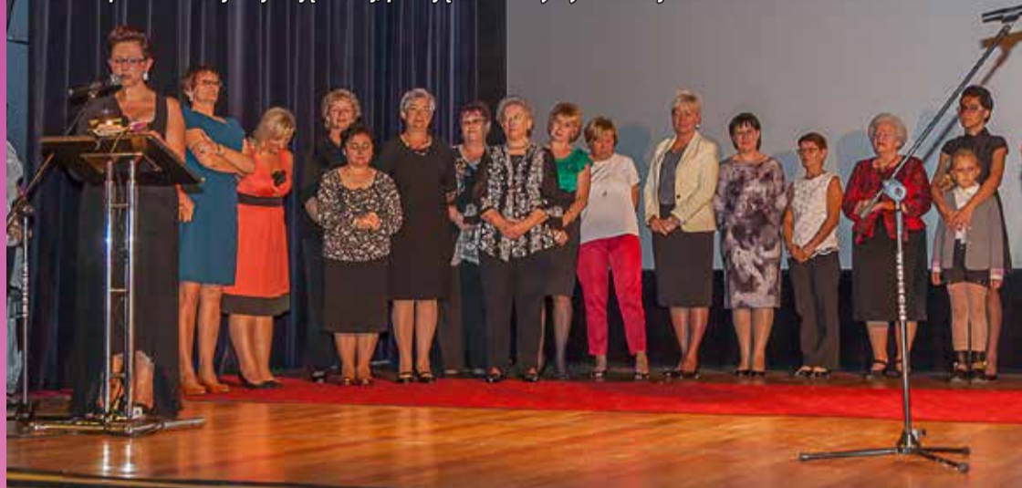
Akademia rozpoczęła się od prezentacji modelek – bogatyńskich Amazonek - które wzięły udział w przebieranej sesji zdjęciowej, pozując w niezwykle kreacjach.