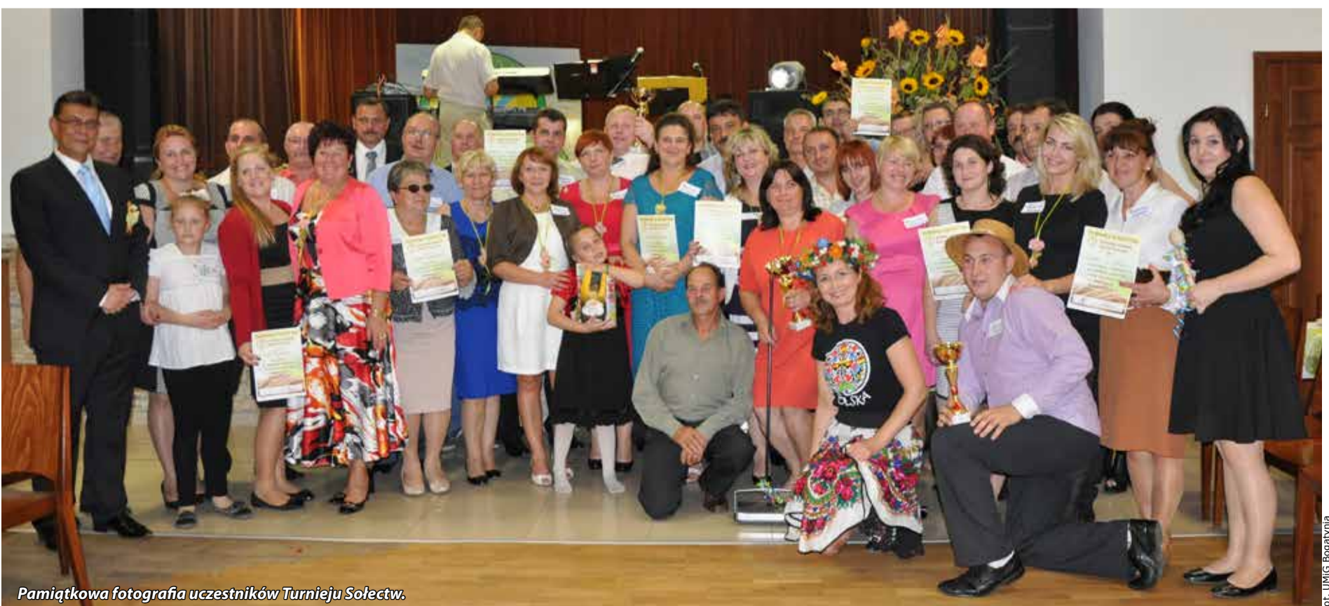
Pamiątkowa fotografia uczestników Turnieju Sołectw.