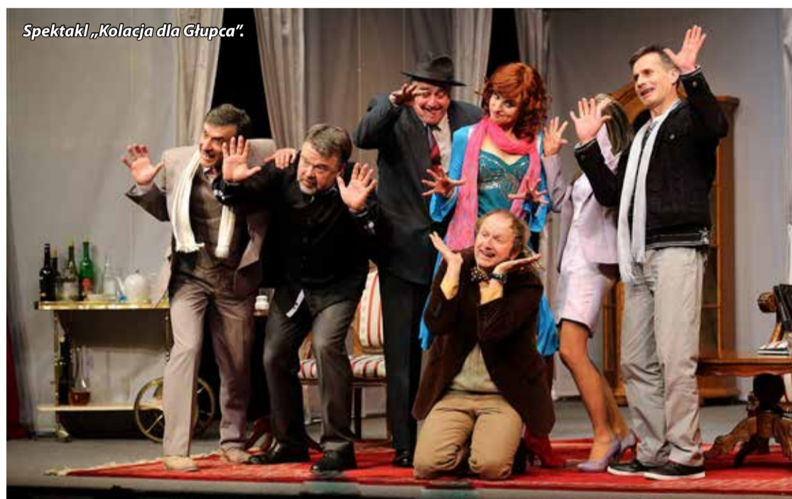
Spektakl „Kolacja dla Głupca”.

Bilety w cenie 25 zł do nabycia w kasie Bogatyńskiego Ośrodka Kultury. Serdecznie i gorąco zapraszamy na spotkanie z teatrem i sztuką! Więcej na www.bok.art.pl