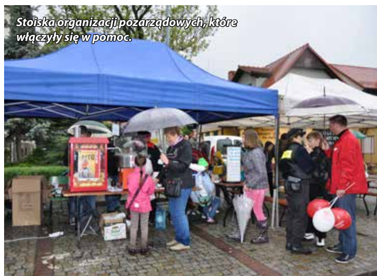
Stoiska organizacji pozarządowych, które włączyły się w pomoc.