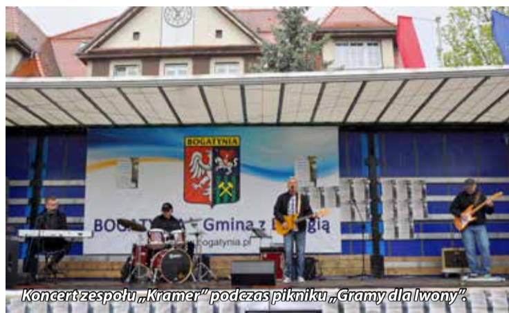
Koncert zespołu „Kramer” podczas pikniku „Gramy dla Iwony”.