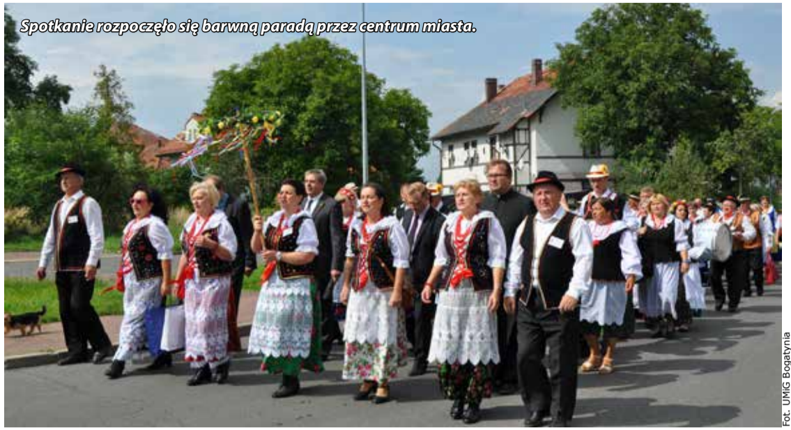
Spotkanie rozpoczęło się barwną paradą przez centrum miasta.