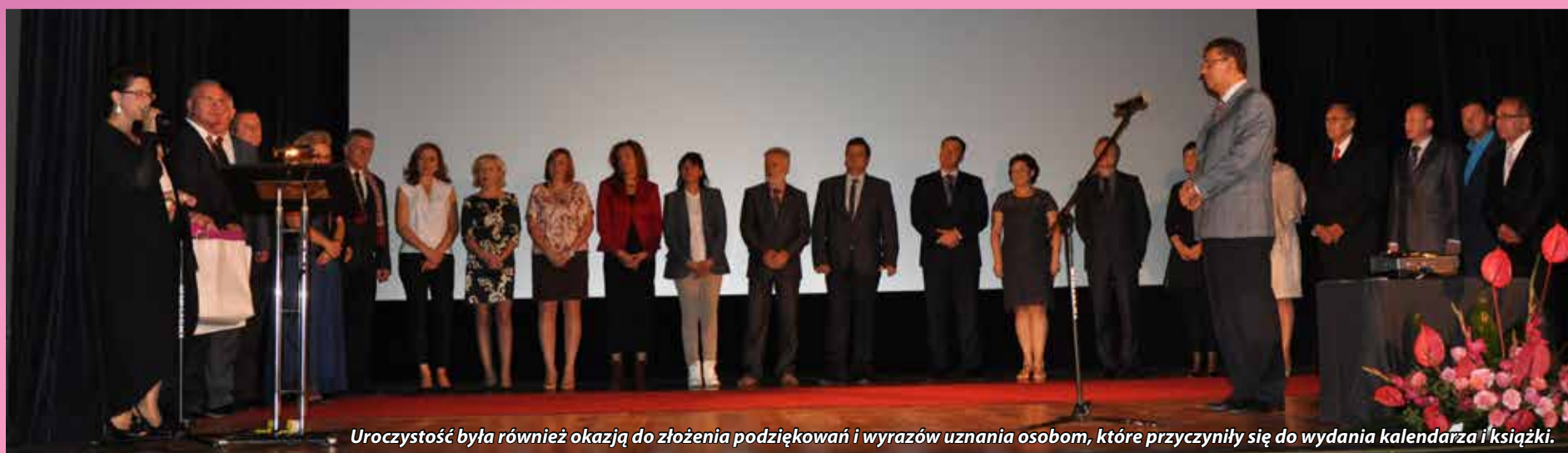
Uroczystość była również okazją do złożenia podziękowań i wyrazów uznania osobom, które przyczyniły się do wydania kalendarza i książki.