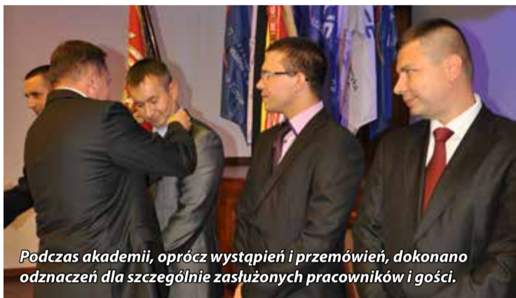
Podczas akademii, oprócz wystąpień i przemówień, dokonano odznaczeń dla szczególnie zasłużonych pracowników i gości.

Następnie głos zabrali goście, którzy, składając gratulacje, życzyli dalszych sukcesów oraz kolejnych wspaniałych rocznic. Podczas akademii, oprócz wystąpień i przemówień, dokonano odznaczeń dla szczególnie zasłużonych pracowników i gości.