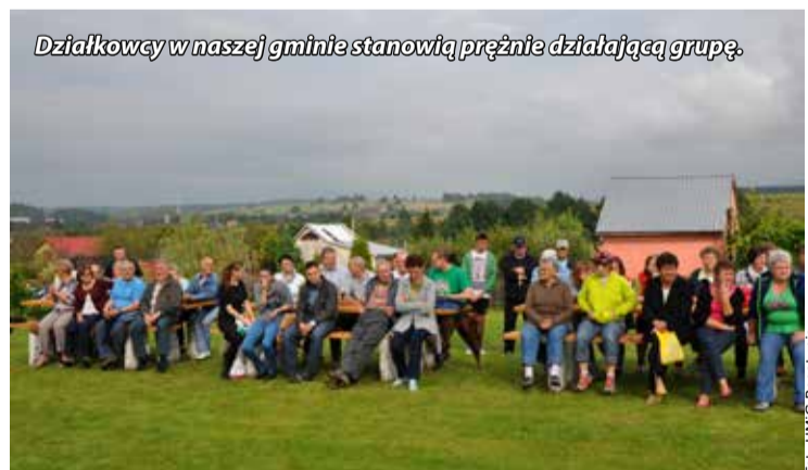
Działkowcy w naszej gminie stanowią prężnie działającą grupę.

Jubileusz był również okazją do wspomnień, a także podsumowania dotychczasowej działalności. Wspaniałej Jubileuszowej uroczystości sprzyjała słoneczna pogoda i miła, rodzinna atmosfera.