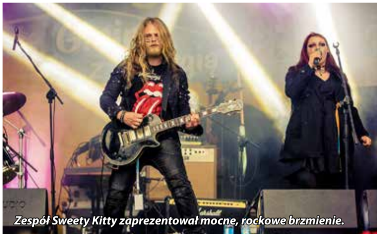
Zespół Sweety Kitty zaprezentował mocne, rockowe brzmienie.

Angielska mieszanka skocznych rytmów, dobre polskie roots reggae i tzw. crossover – to wszystko usłyszeliśmy 29. sierpnia na Wzgórzu Obserwator, podczas 14. Festiwalu Działań Muzycznych. Kolejna edycja festiwalu okazała się przysłowiowym „strzałem w dziesiątkę”.