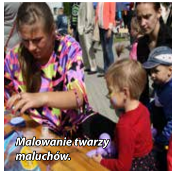
Malowanie twarzy maluchów.

cze, to tylko niektóre z licznie przygotowanych i prezentowanych. Niewątpliwie jedną z wielu atrakcji Jarmarku był również „pchl targ”. Jarmark miał na celu przede wszystkim umożliwienie promowania regionalnych artystów, twórców rękodzieła,