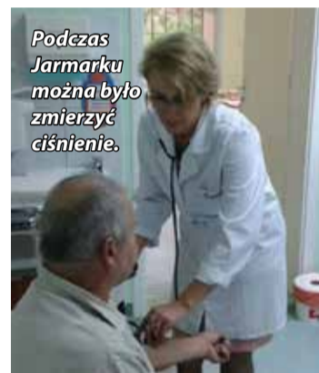
Podczas Jarmarku można było zmierzyć ciśnienie.

Stowarzyszenie Królewska Dolina – Górnoluzycy Działoszyn składa serdeczne podziękowania wszystkim, którzy pomagali w organizacji tego przedsięwzięcia.