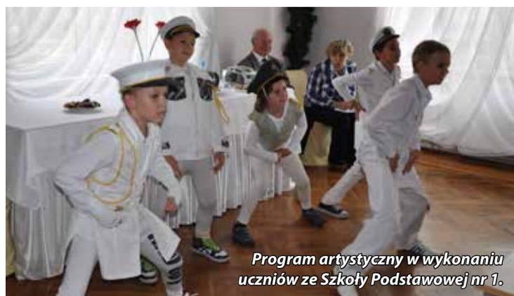
Program artystyczny w wykonaniu uczniów ze Szkoły Podstawowej nr 1.