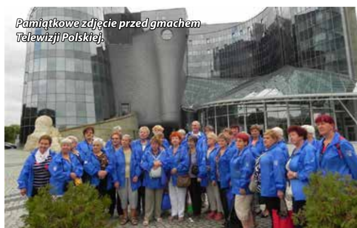
Pamiątkowe zdjęcie przed gmachem Telewizji Polskiej.