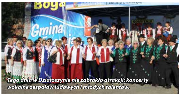
Tego dnia w Działoszynie nie zabrakło atrakcji: koncerty wokalne zespołów ludowych i młodych talentów.

W niedzielę, 24. sierpnia w parafii pw. św. Bartłomieja Apostoła w Działoszynie odbył się odpust ku czci patrona parafii. Uroczystości stały się jednocześnie okazją do zorganizowania jarmarku.