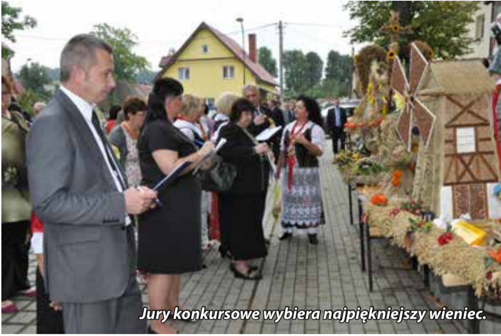
Jury konkursowe wybiera najpiękniejszy wieniec.

Dożynki Gminne 2014 zakończyły się wspólną zabawą do białego rana przy akompaniamencie zespołu, który, grając największe przeboje, zachęcał do wspólnej zabawy.