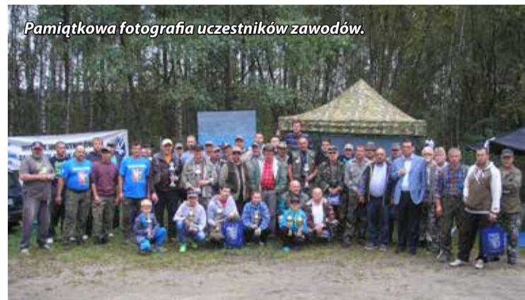
Pamiątkowa fotografia uczestników zawodów.