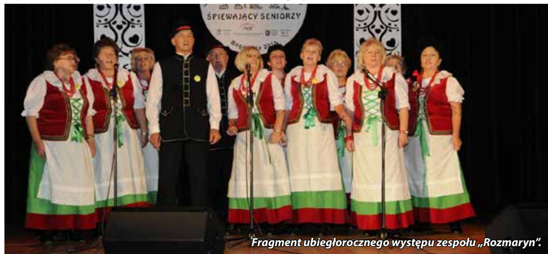
Fragment ubiegłorocznego występu zespołu „Rozmaryn”.

Więcej na www.bok.art.pl . Zapraszamy na spotkanie z tańcem i piosenką! Wstęp wolny. Patronat honorowy Burmistrza Miasta i Gminy Bogatynia.