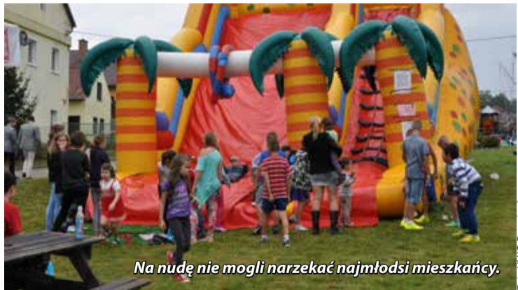
Na nudę nie mogli narzekać najmłodsi mieszkańcy.

brakło również słodkości, np. cieszącej się ogromną popularnością fontanny czekoladowej. Mieszkańcy podczas festynu brali udział w wielu konkursach, w których zdobywali cenne nagrody. Huczna zabawa trwała do białego rana, a festyn zakończył się pokazem sztucznych ogni.