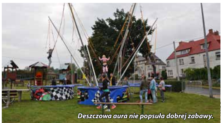
Deszczowa aura nie popsowała dobrej zabawy.