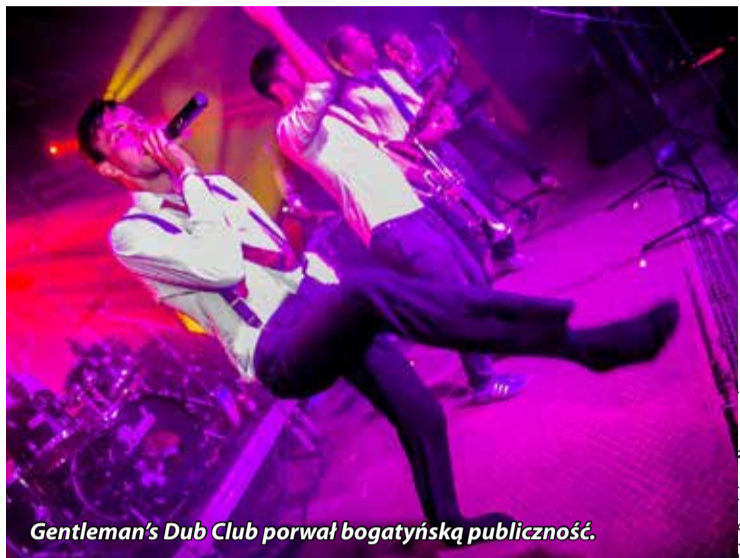
Gentleman's Dub Club porwał bogatyńską publiczność.