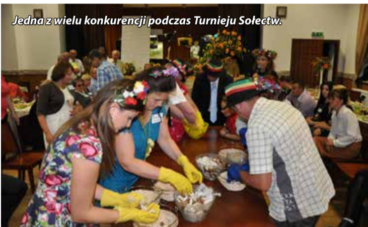
Jedna z wielu konkurencji podczas Turnieju Sołectw.