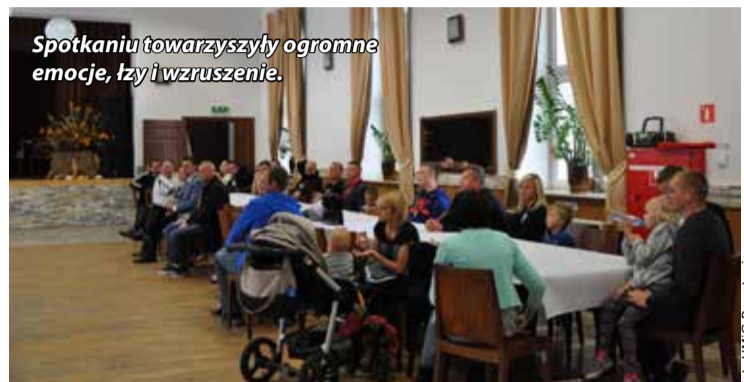
Spotkaniu towarzyszyły ogromne emocje, łzy i wzruszenie.