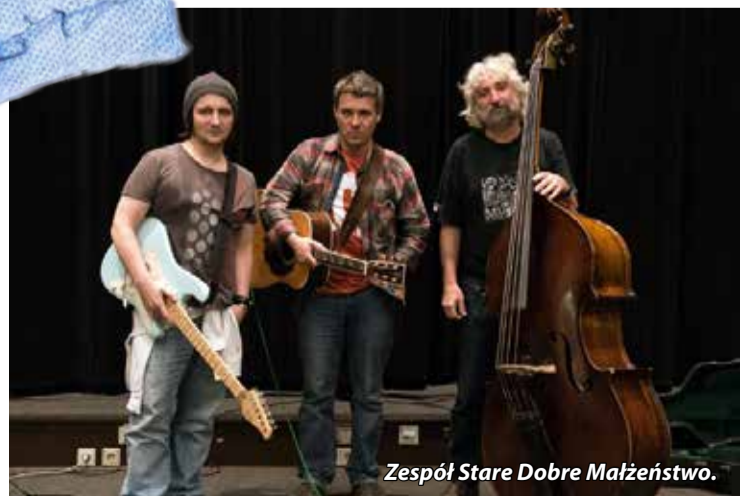
Zespół Stare Dobre Małżeństwo.