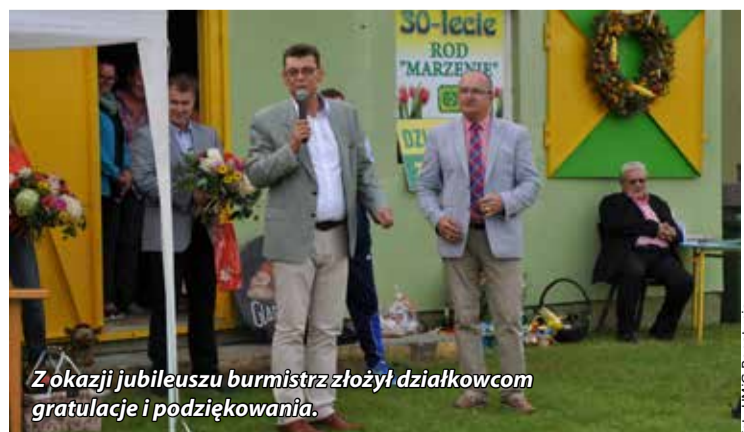
Z okazji jubileuszu burmistrz złożył działkowcom gratulacje i podziękowania.