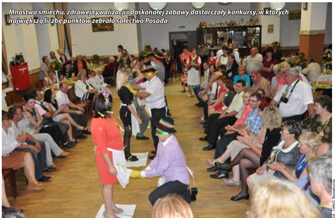
Mnóstwo śmiechu, zdrowej rywalizacji i doskonałej zabawy dostarczały konkursy, w których największą liczbę punktów zebrało sołectwo Posada.