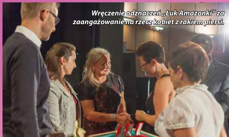
Wręczenie odznaczeń „Łuk Amazonki” za zaangażowanie w rzecz kobiet z rakiem piersi.